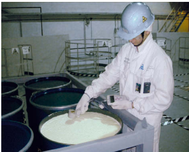
Рис. 5. Радиационный контроль продуктов переработки кубового остатка

и оборудовании комплекса, но достаточной для получения кристаллического плава после глубокого упаривания.