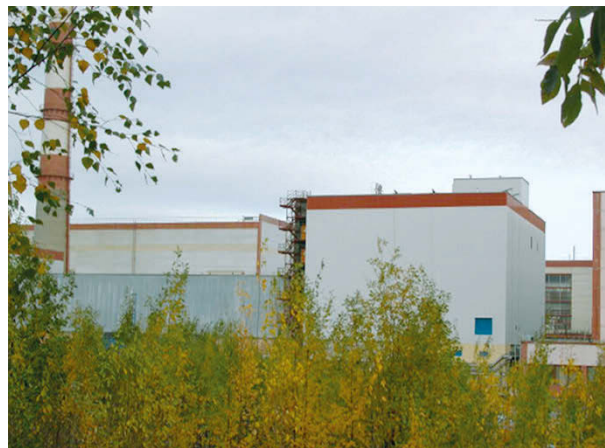
Рис. 3. Современный вид КП ЖРО