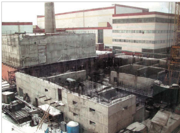
Рис. 2. Сооружение КП ЖРО