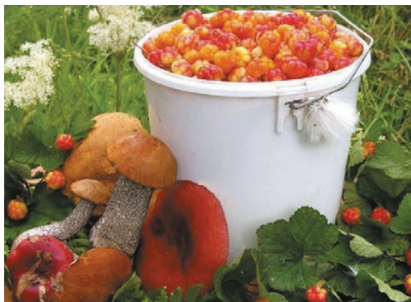
Рис. 3. Ресурсы, используемые для традиционного природопользования коренных малочисленных народов Севера Fig. 3. Resources used for traditional nature management by indigenous peoples of the North

сохраняющей отраслю традиционных видов хозяйственной деятельности коренных народов является арктическое домашнее оленеводство, с которым неразрывно связано повседневное использование родного языка, традиций и обычаев аборигенов. Домашние олени в прямом смысле кормят коренные народы: они дают главный продукт питания — мясо, а также материал для изготовления зимней одежды, обуви, для строительства передвижного жилища, используются как транспортное средство. Только в оленеводстве народы Севера не встречают конкуренции со стороны доминирующего общества.