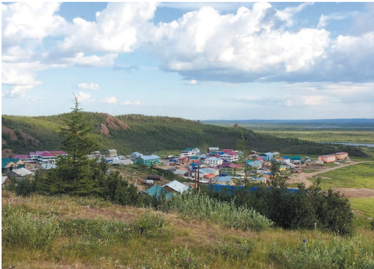
Рис. 1. Общий вид поселка Саскылах. Анабарский национальный (долгано-эвенкийский) улус (район) Республики Саха (Якутия). Август 2017 г. Fig. 1. General view of the village Saskylakh. Anabar national (dolgano-evenk) ulus (district) of the Republic of Sakha (Yakutia). August 2017.

механизм часто реализуется на основе системы компенсационных платежей, возмещения причиненного вреда в результате воздействия на территории традиционного природопользования и заключения соглашений о развитии данной территории. Такой подход реализуется на основе процедуры этнологической экспертизы проектов, которая успешно применяется, например, в Республике Саха (Якутия) с 2011 г. [11; 12].