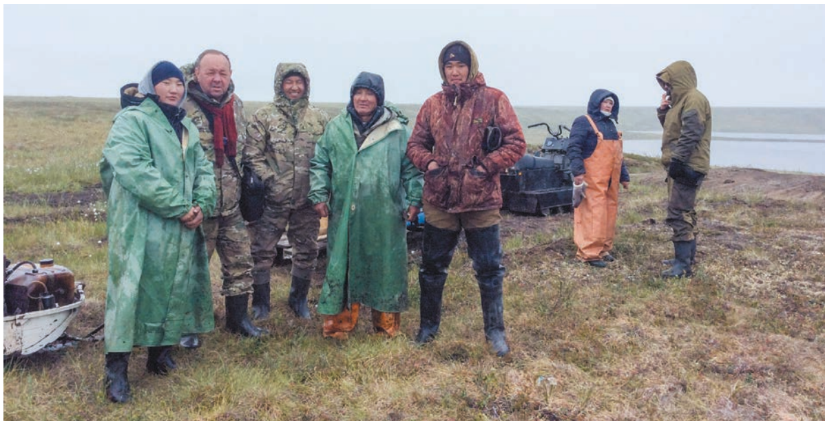
Рис. 2. Встреча с оленеводами в тундре. Поселок Хайыр. Усть-Янский улус Республики Саха (Якутия). Август 2017 г.